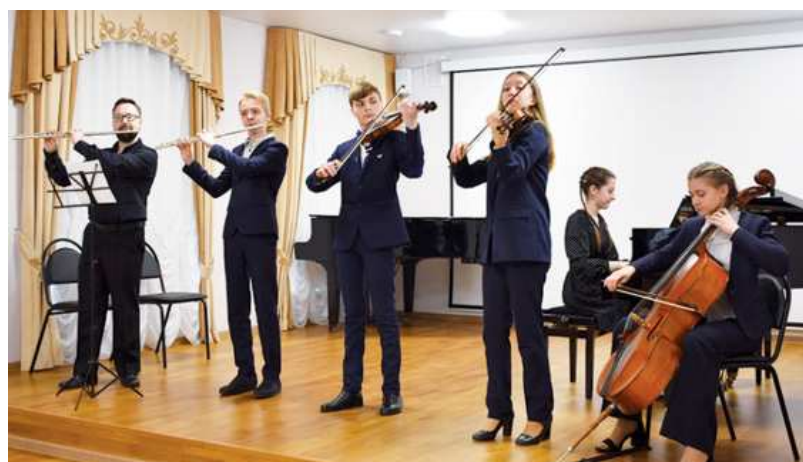
Одно из конкурсных выступлений