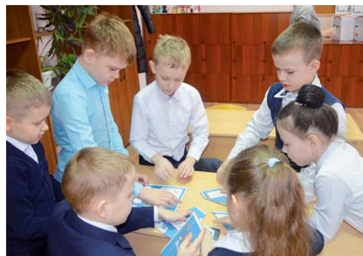
Задания для ребят

Школьникам рассказали о правилах пользования газовыми приборами, необходимых действиях при появлении запаха газа. Показали мультфильм «Секреты природного газа» и на его основе провели викторину. Не менее интересными для учеников младших классов оказались другие задания.