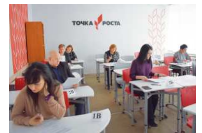
Родители выпускников пишут ЕГЭ по русскому языку