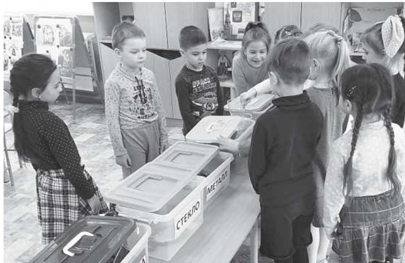
Дошкольники учатся сортировать отходы

С первым мифом «Один в поле не воин» они справились, обратившись к статистике. Ока-