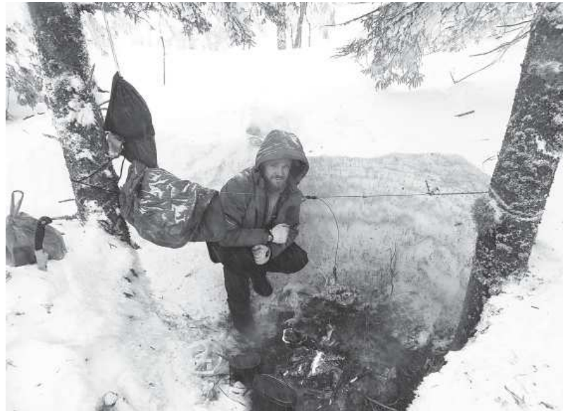
У разведённого костра

Текст: ТАМАРА САНТЫЛОВА