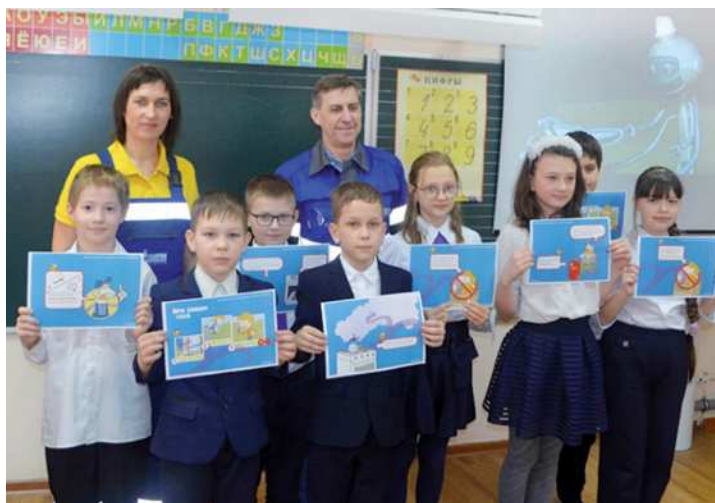
Сотрудники газовой службы Котовска на встрече с учащимися

Встречи с котовскими и знаменскими школьниками