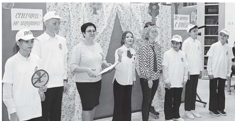
Актёры школьного театра «Радуга»

Развитию актёрских способностей юных котовчан вне школ способствуют также ТЮЗ, театральная студия «Затейники», театральная инклюзивная школа «Золотой ключик», которые действуют в ДК. В ДШИ спросом у ребят пользуется студия «Театралы».