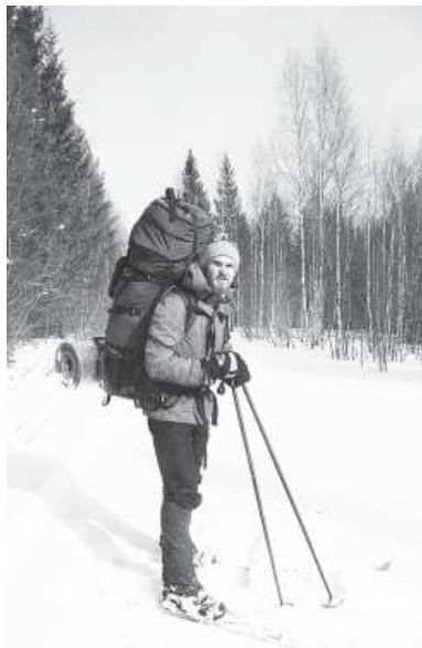
В пути по Южному Уралу